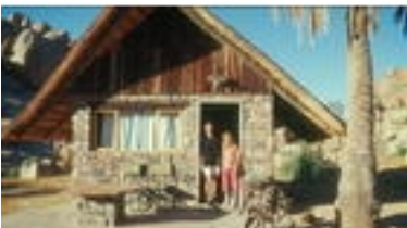
Die Lodge ist ein geräumiges Zimmer mit persönlicher Betreuung,